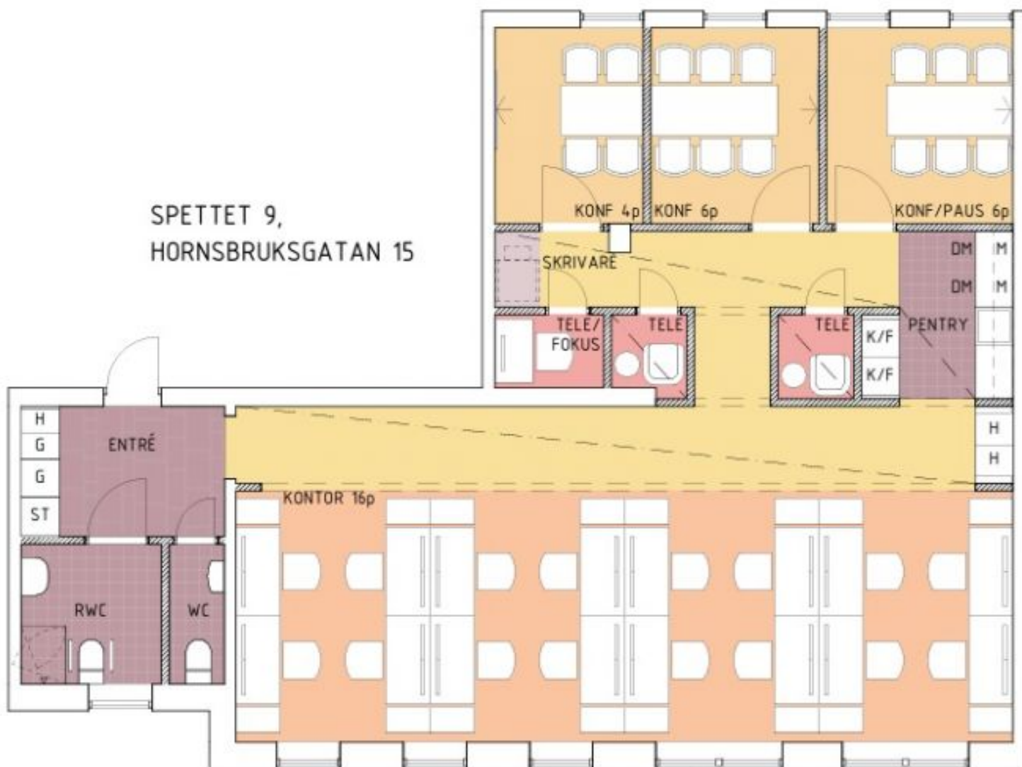
MÖBLERAD PLAN, LANDSKAP (BORD 1,4x0,7) (MINDRE BORD FLER PLATSER) TOTAL 16p